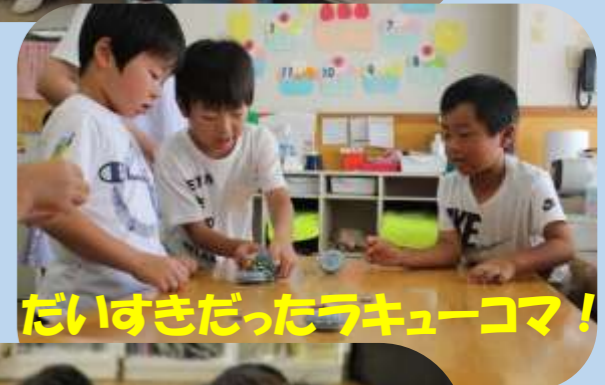
大好きだったラキューコマ！！