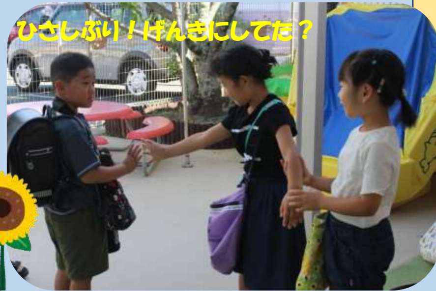
ひさしぶり！げんきにしてた？