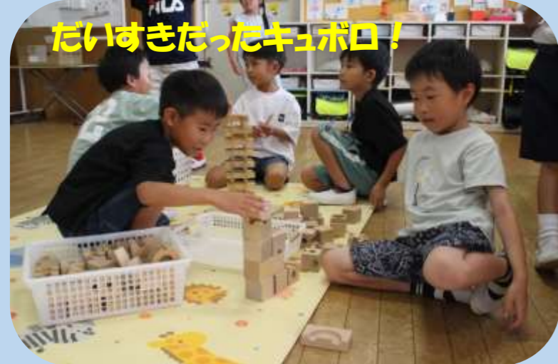
大好きだったキューボロ！