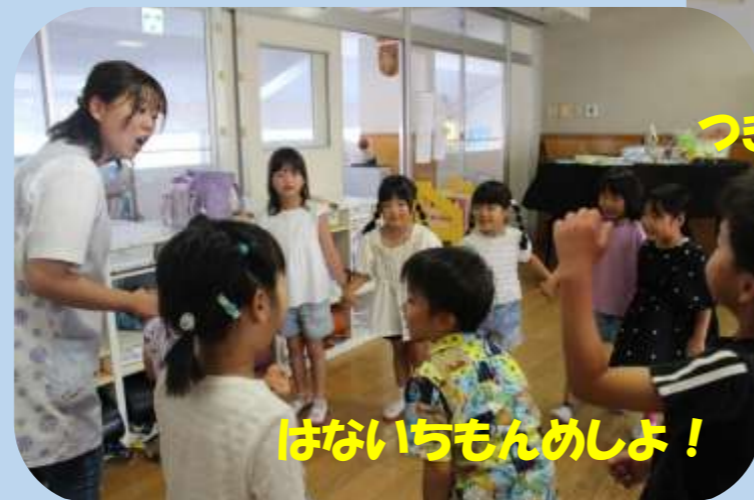
はないちもんめしよ！